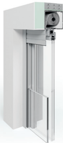
Expert XT Einbausituation bei WDVS