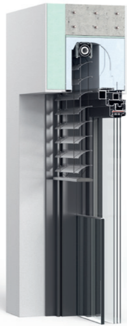
Thermo NB 4.0 Revision außen Raffstore Einbausituation bei WDVS