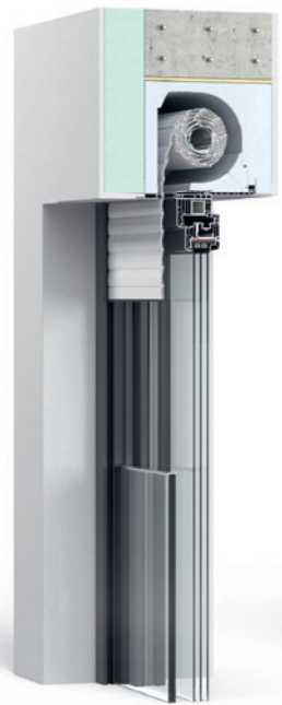
Thermo NB 4.0 Revision innen Einbausituation bei WDVS

Ein umfassender Schutz gibt Vertrauen: DuoTherm Sicherheitslösungen machen aus einem Ort ein Zuhause, das Ruhe und Geborgenheit schenkt. Sie passen auf, wenn sonst keiner aufpasst, und geben das Gefühl, immer auf der sicheren Seite zu sein. Auf Qualität von DuoTherm ist immer Verlass.