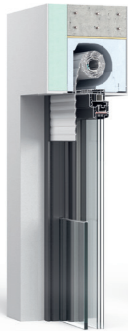
Thermo NB 4.0 Revision außen Einbausituation bei WDVS